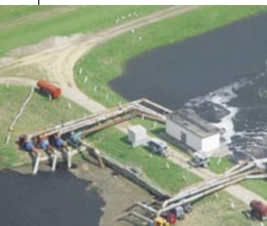
Provisorische Pumpenanlage an der Stelle, wo das Hochwasser auf das Binnenwasser trifft