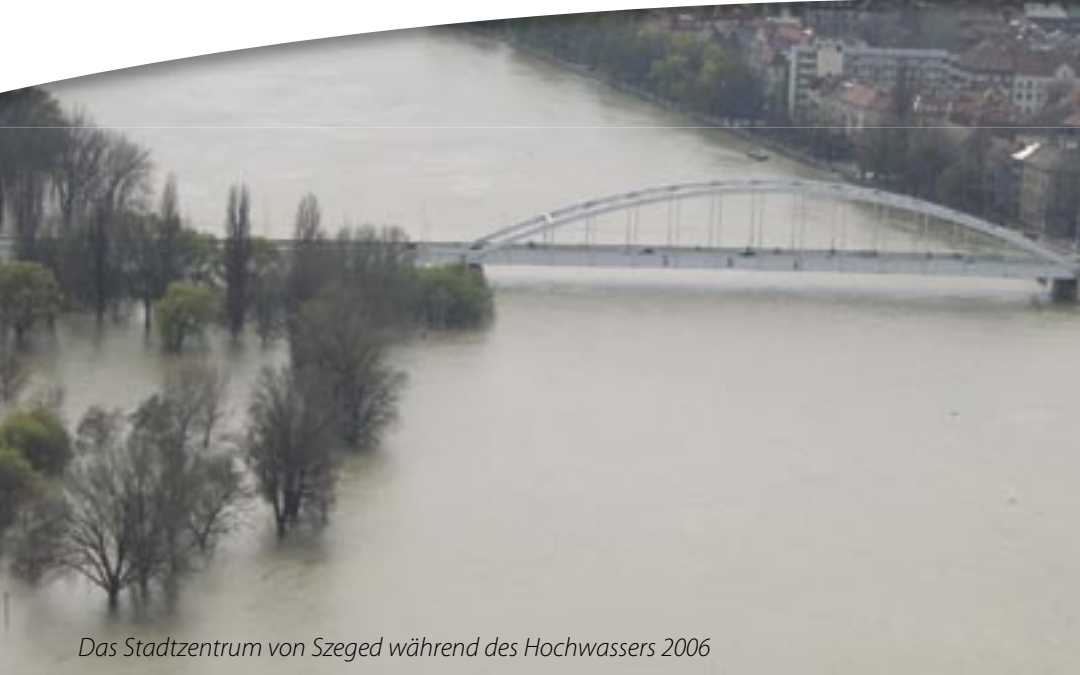
Das Stadtzentrum von Szeged während des Hochwassers 2006