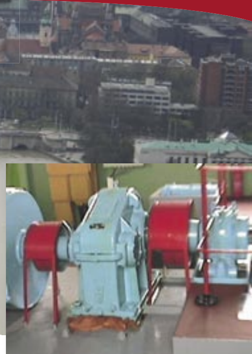
◆ Maschinen im Pumpenhaus