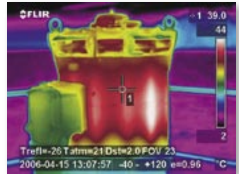
◆ Pumpenanlage im Freien